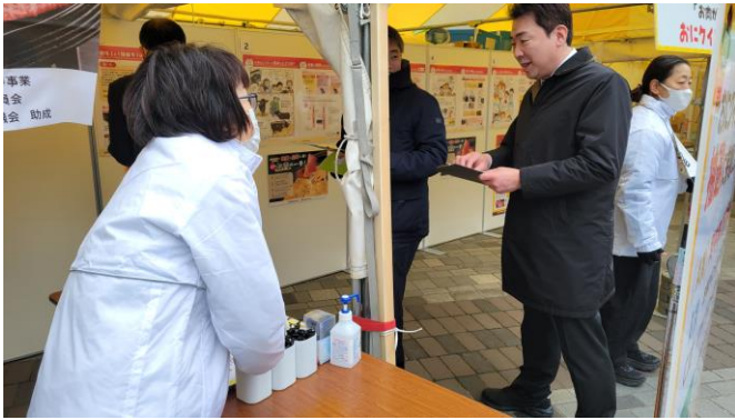
おにクイズラリー