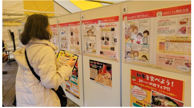
おにクイズラリー