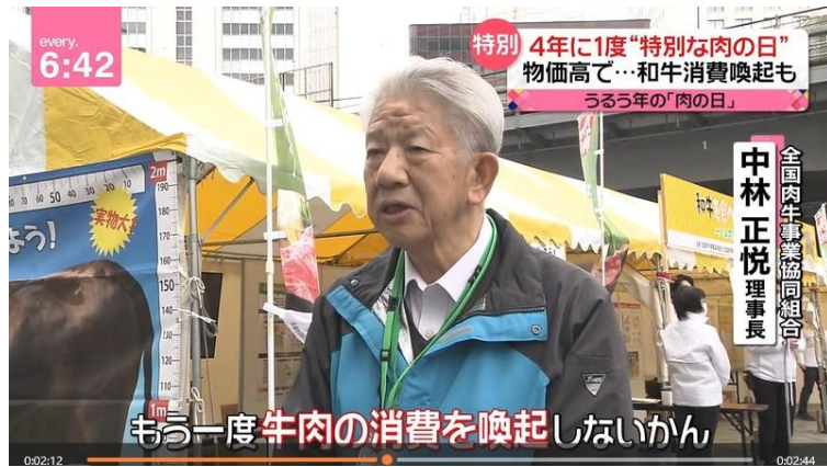
*2024.02.29 NTV news every.