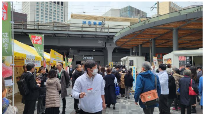
マルイ側からみた様子