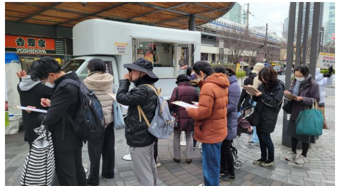
試食待機列の様子