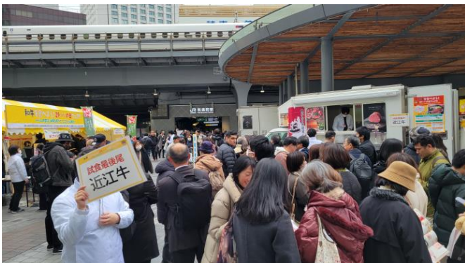
試食待機列の様子