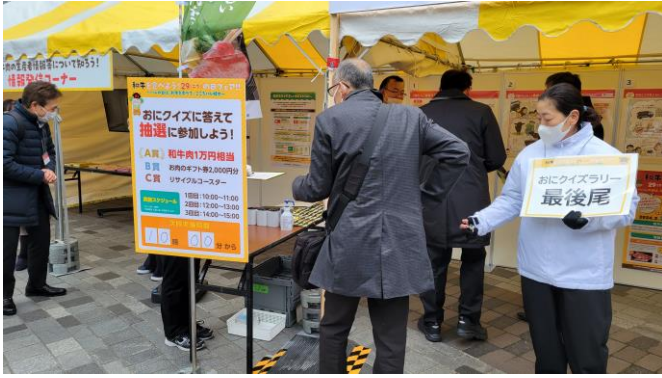
おにクイズラリー