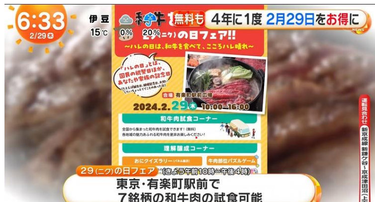
*2024.02.29 CX めざましテレビ