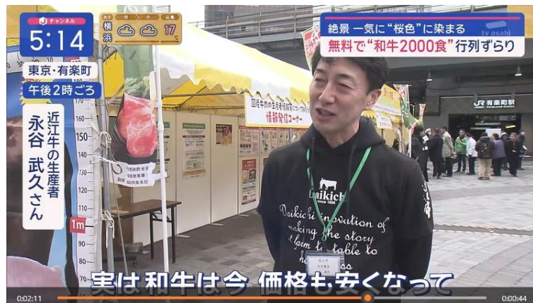
*2024.02.29 EX スーパーJチャンネル