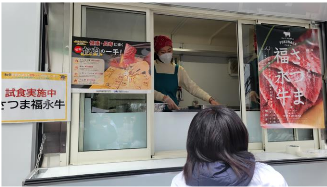
キッチンカー装飾