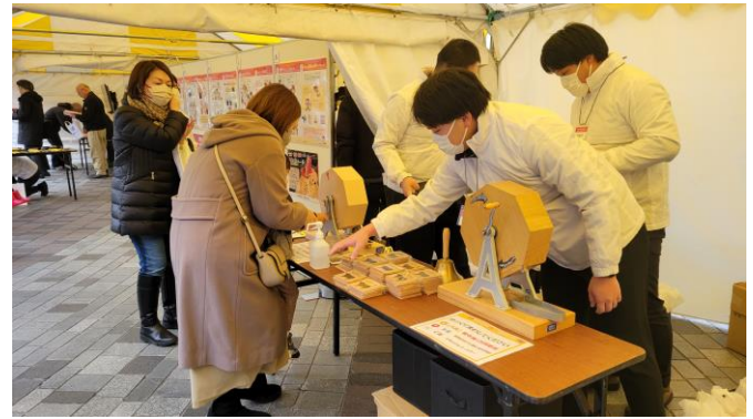
おにクイズラリー