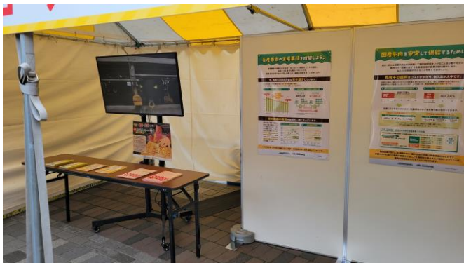
情報発信コーナー