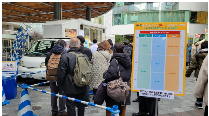
試食スケジュールサイン