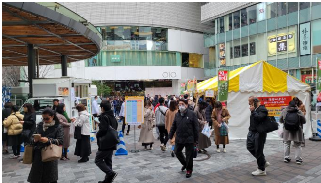
駅改札側からみた様子