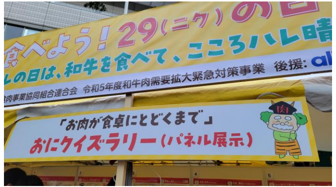
メインサイン/コーナーサイン