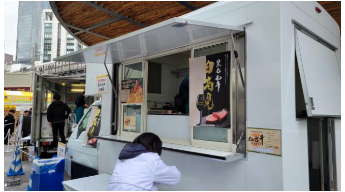
キッチンカー装飾