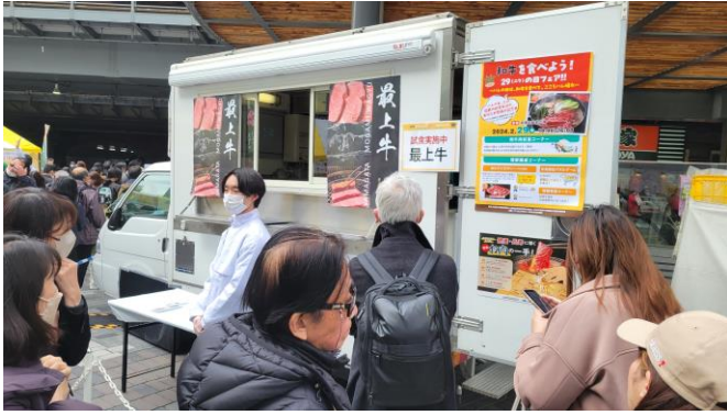
キッチンカー装飾