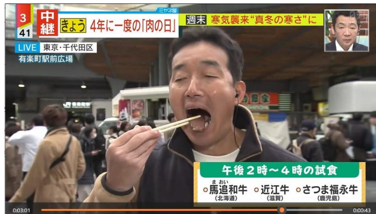
*2024.02.29 NTV ミヤネ屋