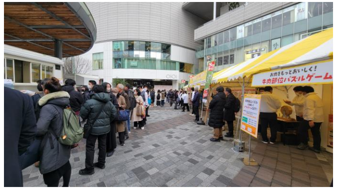
駅改札側からみた様子